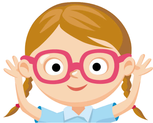
èist le do chluasan