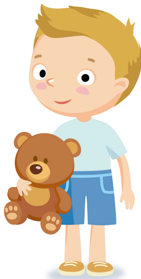
cùm grèim air an tòidh